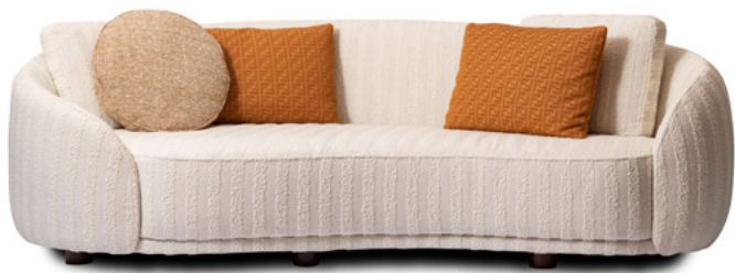
045002 — 2-seater sofa

Gondola), velvets (Calle, Tie1, Tie2, Tie3), Bejing and Seoul. Available in all leathers excluding Capitolino leather. Seat and back piping — Ø 4 mm tone-on-tone piping in FENDI FF, FENDI Micro FF or FENDI Pequin fabric. Cushions — Decorative down feather cushions (not included) available in three sizes: 600x400 mm (cushion with Ø 3 mm tone-on-tone piping), 500x400x35 mm (cushion with Ø 3 mm tone-on-tone piping); Ø 500x40 mm (cushion with Ø 3 mm tone-on-tone piping).