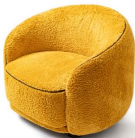
045001 — Armchair

Gondola), velvets (Calle, Tie1, Tie2, Tie3), Bejing and Seoul. Available in all leathers excluding Capitolino leather. Seat and back piping — Ø 4 mm tone-on-tone piping in FENDI FF, FENDI Micro FF or FENDI Pequin fabric. Cushions — Decorative down feather cushions (not included) available in three sizes: 600×400 mm (cushion with Ø 3 mm tone-on-tone piping); 500×400×35 mm (cushion with Ø 3 mm tone-on-tone piping); Ø 500×40 mm (cushion with Ø 3 mm tone-on-tone piping).