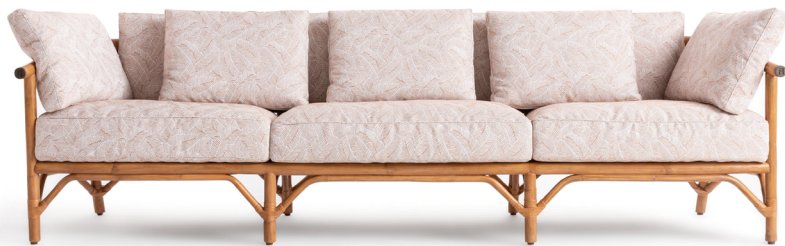
051 004 — Sofa

logo in Old Bronze finish. Seat and Backrest — Specific padding for outdoor use, water repellent and seamless. Backrest with 6 cushions (2-seater version) or 9 cushions (3-seater version). Upholstery — Seat and back cushions are in specific outdoor fabrics: Ubud, Bali, Koror, Palau e Ulong, each of them available in four colours.